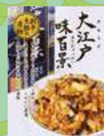
大江戸味百景(割千大根)