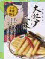
大江戸三昧(里ごぼう)