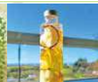
フルーツのハーバリウム