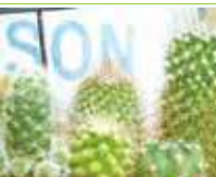
サボテンの寄せ植え