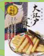
大江戸三昧(里ごぼう)