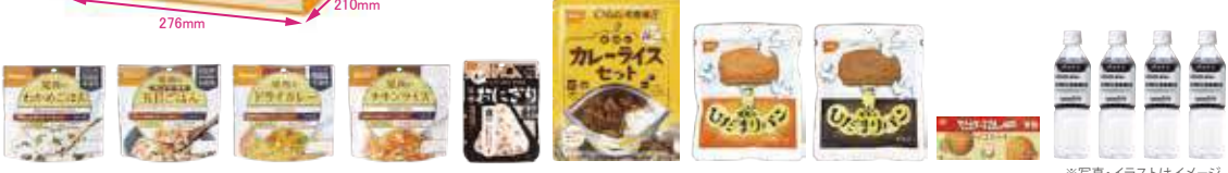
※写真・イラストはイメージ