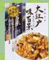
大江戸味百景(割干大根)