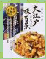
大江戸味百景(割干大根)