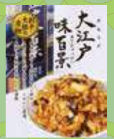
大江戸味百景(割干大根)