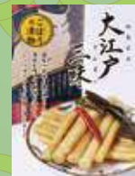
大江戸三昧(里ごぼう)